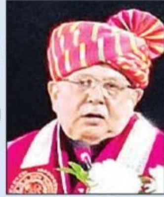
समारोह को संबोधित करते कृषि मंत्री।