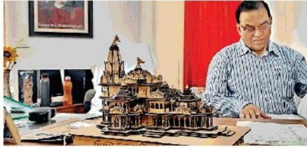
अवध विश्वविद्यालय की केंद्रीय लाइब्रेरी में रखा राम मंदिर का मॉडल

गत दिनों रामनगरी के कई आयोजनों में छोटे मॉडल स्मृति चिह्न के रूप में भेंट किए गए। हाल ही में समाप्त हुए अयोध्या महोत्सव में अतिथियों को मंदिर का मॉडल स्मृति चिह्न के तौर पर भेंट किया गया तो बीती 12 मार्च